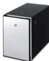
Lodówka Fridge S