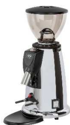
Młynek MACAP M42D