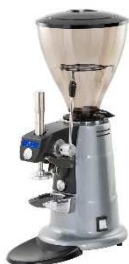
Młynek MACAP MXDZ