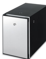
Lodówka Fridge S