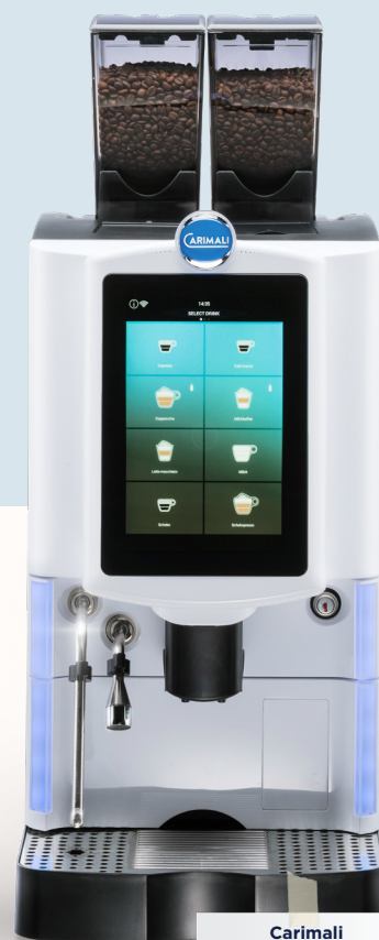
Carimali Optima Ultra