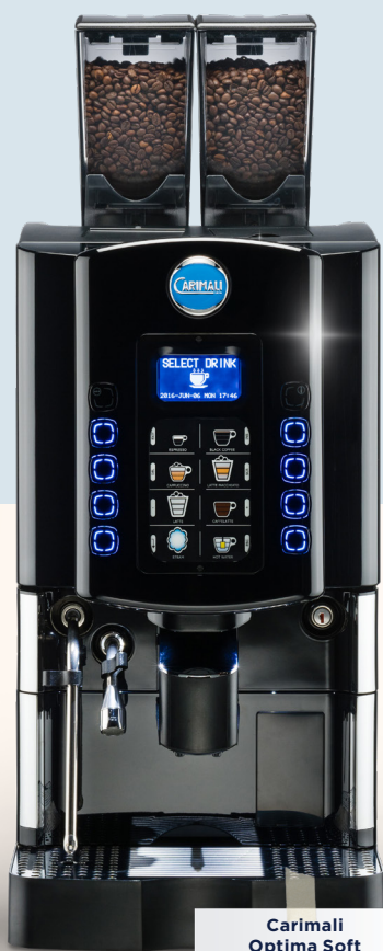
Carimali Optima Soft