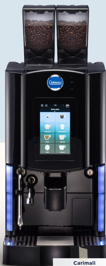
Carimali Optima Soft Plus