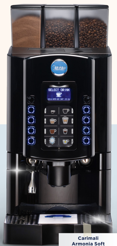
Carimali Armonia Soft