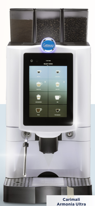
Carimali Armonia Ultra