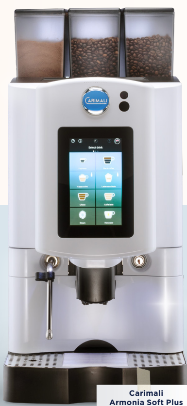
Carimali Armonia Soft Plus